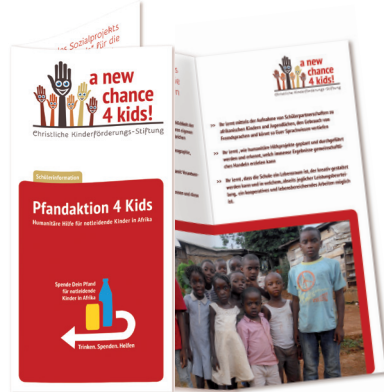
Schülerinformation Din lang, 4-seitig