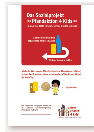
Pfandaktions-Plakate Din A2